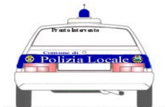
Autovettura vista posteriore