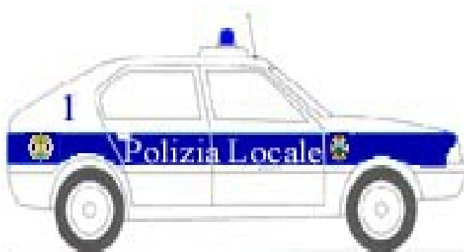
Autovettura vista laterale