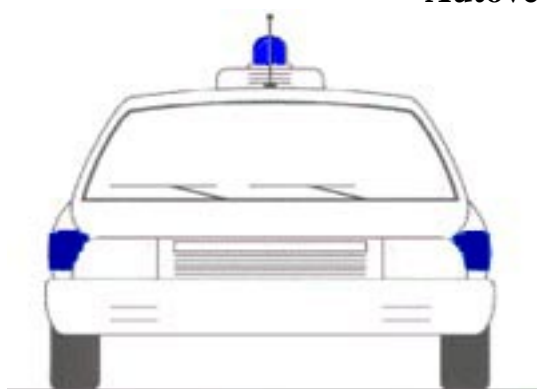
Autovettura vista frontale