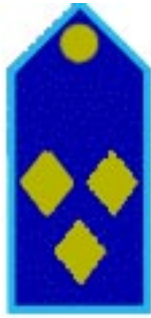
Ispettore Capo D3