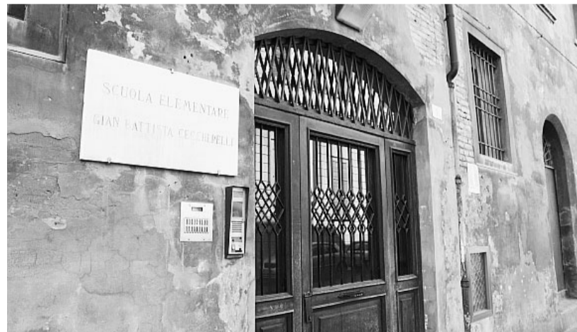
L'ingresso delle scuole elementari «Ceccherelli»

E' nota per contare nelle sue aule il più alto numero di alunni stranieri, oltre l'80% del totale, e ora è tornata al centro delle polemiche per la decisione, presa dal Comune già alcuni anni fa, di chiuderla definitivamente. Stiamo parlando delle scuole elementari «Ceccherelli», istituto situato nel cuore del centro, sulle cui sorti ieri è intervenuto anche il consigliere regionale del Pdl Andrea Leoni . «Una scuola elementare obbligata alla chiusura - ha attaccato in una nota - perché le famiglie non iscrivono più i loro figli a causa dell'alta percentuale di alunni stranieri, è un fatto gravissimo. Quello che è successo alla scuola elementare Ceccherelli, trasformata di fatto in un ghetto, potrà avere un devastante effetto a catena se nella nostra città si continuerà sulla strada del multiculturalismo percorsa in questi anni dalle amministrazioni di sinistra. L'aumento esponenziale di stranieri, ha provocato in pochi anni un rallentamento dell'attività didattica, la ghettizzazione all'interno delle classi e la mancata integrazione dei ragazzi. Tutto ciò ha allontanato dall'istituto sempre più famiglie che, dovendo iscrivere i propri figli in